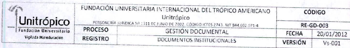
Tabla No. 001