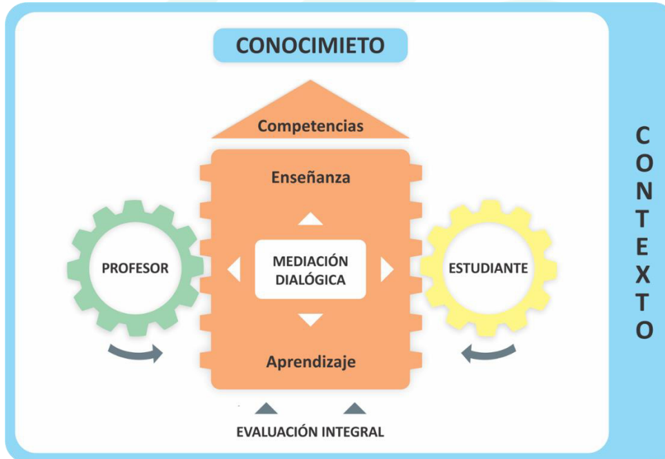
Figura 3. Modelo Pedagógico Unitropista