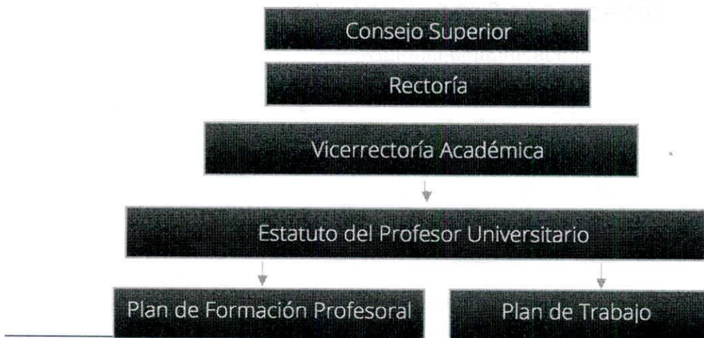
Figura 1. Estructura organizacional

La estructura organizativa para la operación de la Política de Formación Profesoral de la Universidad se muestra a continuación: