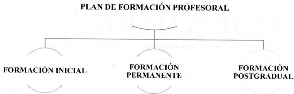
Gráfico No. 4. Estructura del Plan de Formación Profesional.

En este segmento se describirán uno a uno los ejes y se definen las líneas anteriormente citadas, al final de cada segmento se encuentran discriminados el tipo de formación requerida, las metas y el impacto esperado sobre la población profesoral. Las metas que se presentan aquí servirán de orientación para la formulación de metas en plazos menores planteadas en otras actuaciones estratégicas institucionales, así mismo, el nivel de impacto esperado que se proyecta podrá servir como derrotero para la planeación de indicadores concretos dentro de dichas actuaciones.