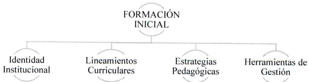
Gráfico No. 5. Líneas de Formación inicial.

Inicialmente, el plan de formación profesoral está orientado a facilitar, por un lado, la incorporación del nuevo personal profesoral e investigador a Unitrópico y, por otro, a proporcionarle una formación inicial para el ejercicio de la función de la docencia en el comienzo de su actividad profesoral. Este eje, a su vez, se subdivide en tres líneas: